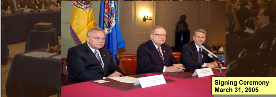
Signing Ceremony March 31, 2005